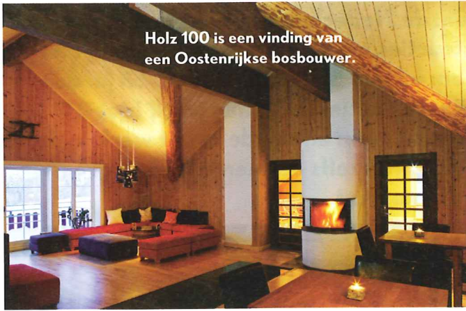
Holz 100 is een vinding van een Oostenrijkse bosbouwer.

gecertificeerd Siberisch lariks gemoeid. Een ander werk dat er uit springt is de houtconstructie voor twee zoutloosden van 30 bij 140 meter in Oss. Die constructies zijn door onszelf uitontwikkeld. Een zeer omvangrijk project gaat volgend jaar van start, als we gaan leveren aan de bouw van het nieuwe Centraal Station in Rotterdam. We bereiden ons nu voor op de aanvoer van maar liefst 2.800 m 3 gelamineerd hout voor dat NS-station."