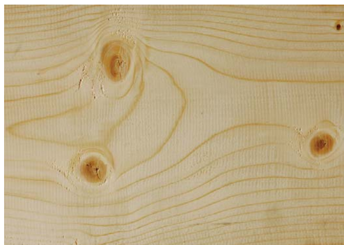
Bild 3 Querschnittsver-schwächung und örtliche Faserabweichung infolge eines Astes

Mittlerweile weitgehend akzeptierte Vorgaben zum Astzustand bei BS-Holz enthalten das inzwischen überarbeitete BS-Holz-Merkblatt (Ausgabe August 2001) der Studiengemeinschaft Holzleimbau e.V. [9], die daran angelehnte ÖNORM B7215 „Zimmermeister- und Holzbauarbeiten – Verfahrensnorm“ [14] und die „Vereinbarung über BS-Holz“ [7]. Ein grundsätzlicher Ausschluss von Füll-