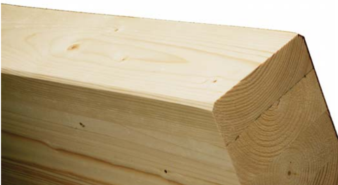
Bild 12a, b Scharfkantiges und gefastetes Brett-schichtholz