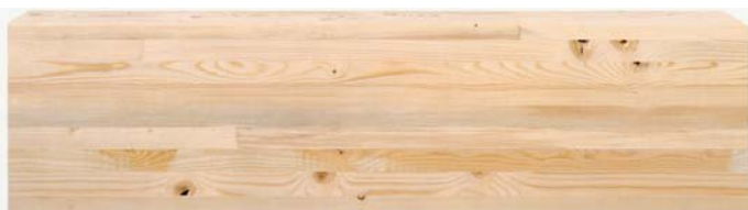
Bild 7 Verblautes BS-Holz

Sind Verschmutzungen nicht sicher auszuschließen, so sollten die Bauteile während Transport, Lagerung und Montage durch eine Umantelung mit diffusionsoffenen Folien oder durch Verwendung von temporären Witterungsanstrichen geschützt werden.