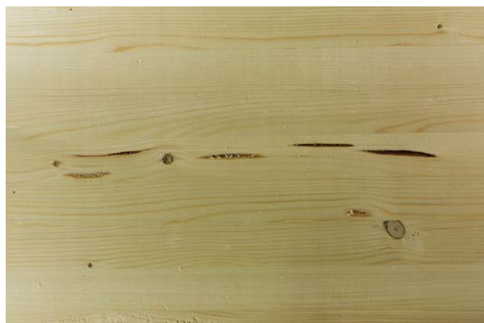
Bild 5 Harzgallen

auch für den deutschen Markt empfohlen werden. Die Beschränkung der zulässigen Breite von Harzgallen auf 5 mm für die Sichtqualität stimmt dabei mit den Vorgaben der Vereinbarungen über KVH®, Konstruktionsvollholz MH® und Duo-/Triobalken® überein.