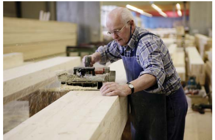
Bild 1 Oberflächenbearbeitung in einem BS-Holz-Werk

Im Folgenden sollen zunächst die wesentlichen, den optischen Eindruck bestimmenden Parameter einzeln diskutiert und danach ein Schema für die Beurteilung von BS-Holzbauteilen bei der Anlieferung bzw. im eingebauten Zustand angegeben werden.