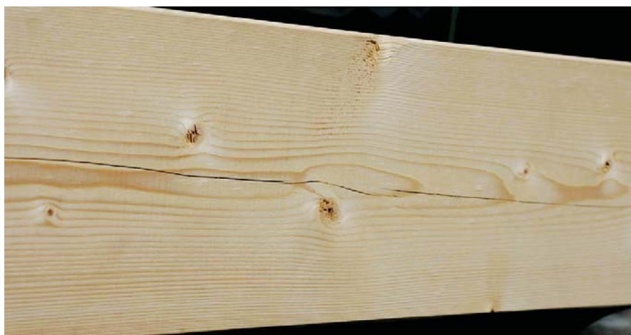
Bild 6 Schwindrisse in einer Decklamelle

bzw. bei stärkerem Nachtrocknen der Bauteile nach dem Einbau ist mit tieferen Rissen zu rechnen.