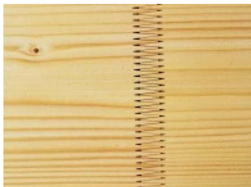
Bild 9 Keilzinkung in einer Brettschichtholzlamelle

Bezüglich der Tragfähigkeit sind die Anzahl sowie der Abstand der Keilzinkenverbindungen in einer Lamelle zwar nicht limitiert, produktionsbedingt beträgt der Abstand zwischen einzelnen Keilzinkungen in der Regel zwischen etwa 2 m und 4 m. Werden allerdings ausnahmsweise sehr hohe Anforderungen an den maximalen Astdurchmesser gestellt, so kann dies zu deutlich geringeren Abständen füh-