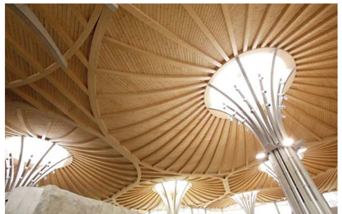
Bild 2 Dachkonstruktion Elefantenhaus Zoo Köln