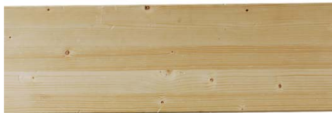
Bild 8 Mit hellem Klebstoff hergestelltes BS-Holz

Die Zinkengründe von Keilzinkungen in tragenden Bauteilen dürfen, anders als die von nichttragenden Keilzinkungen z.B. für den Fens-