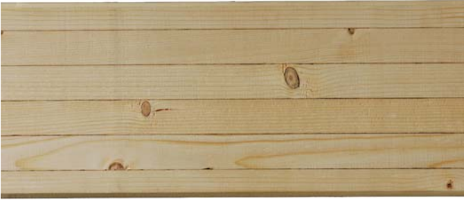
Bild 11 Gehobeltes Brett-schichtholz mit lokaler Rau-igkeit im Bereich eines Astes

Üblicherweise werden Brettschichtholzbauteile gehobelt. Auch bei einer ordnungsgemäßen Hobelung können leichte, vereinzelte Hobelschläge besonders an den Enden der Bauteile nicht gänzlich vermieden werden. Diese können in den meisten Anwendungsbereichen toleriert werden. Das Gleiche gilt auch für die aufgrund größerer Faserabweichungen (z. B. im Bereich von Ästen) oder im Bereich von Keilzinkungen beim Hobeln entstehenden, räumlich begrenzten rau- en Bereiche.